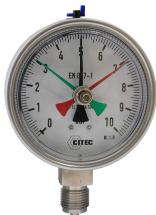
Manomètre avec aiguille suiveuse mini et maxi