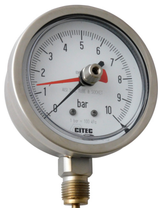
Manomètre avec aiguille suiveuse